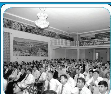
БЕҲТАРИН РОҲИ ПЕШГӢРӢ АЗ ХУРОФОТУ ТААССУБӢ ИН Рӯ ОВАРДАН БА ФАРҶАНГИ МИЛЛИСТ 5