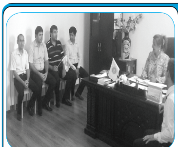
ҲИЗБИЁН ДАР ИҶРОИ НАҚШАИ ОБУНА-2019 МАСЪУЛИЯТИ БАЛАНД ДОРАНД 4

Тавре дар шумораи гузаштаи нашрияи “Ҳамрози халқ” хабар дода будем, санаи 27.06.2018 маҷлиси Кумитаи иҷроияи ҲХДТ дар вилояти Хатлон баргузор гардида, дар рафти он оид ба натиҷаҳои фаъолияти Кумитаи иҷроияи ҲХДТ дар вилояти Хатлон дар нимсолаи аввали соли 2018 ва вазифаҷо барои нимсолаи дуюм гузориш дода шуд. Матни пурраи гузориширо аз саҳифаҳои минбаъдаи ҳамин шумора пайдо хоҳед кард.