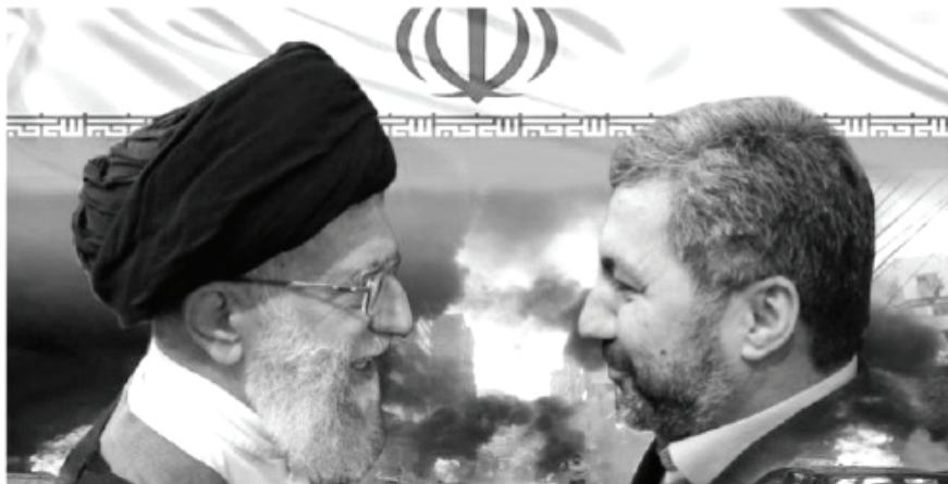
تهدد طاجيكستان.. إيران تنقل مقاتلي حزب النهضة من سوريا لأفغانستان

الرئيسية / العالم / تهدد طاجيكستان.. إيران تنقل مقاتلي حزب النهضة من سوريا لأفغانستان