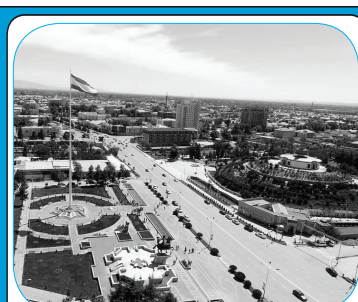
ОИНИ ШАҲРИНИШИӢ ВА ТАРБИЯИ ЗАВҚИ ЗЕБОИПАРАСТИИ СОКИНОН ОМИЛИ РУШДУ ОБОДИСТ! 7