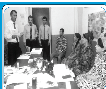
ХИЗМАТ БА МАРДУМ ШАРАФИ БУЗУРГ АСТ! 6