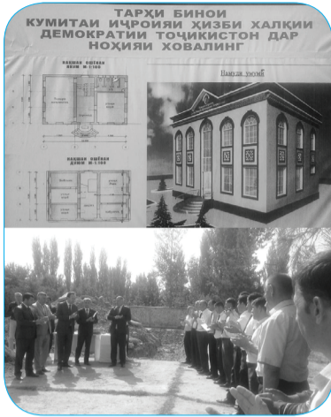
Дар пайи иҷрои дастуру супоришҳои Асосгузори сулҳу ваҳдати миллӣ, Пешвои миллат,

Раиси муаззами Ҳизби Халқии Демократии Тоҷикистон мухтарам Эмомалӣ Раҳмон, ки дар рафти маҷлиси Кумитаи Иҷроияи Марказии ҲХДТ санаи 16 феввали соли равон ҷиҳати то охири соли 2019 таъмин будани ҳамаи сохторҳои Ҳизби халқӣ бо бинои маъмурии Ҳизби ироа гардид, дар саросари вилояти Хатлон сохтмони биноҳои маъмурии Ҳизби оғоз гашта истодаанд.