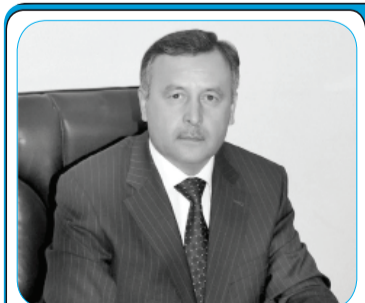
ИҚТИСОДИ ВИЛОЯТИ ХАТЛОН РУШД КАРДА, ЧОЙҲОН НАВИ ҚОРӢ ТАЪСИС ДОДА ШУДАНД 8

Дар 20 соли ахир дар партави сиёсати созандаи Пешвои муаззами миллат муҳтарам Эмомалӣ Раҳмон наздик ба як миллион оилаҳои ҷавон соҳиби хонаҳои истиқоматӣ шуданд, Оилае нест, ки телевизорӣ ранга, мошини ҷомашӯӣ надошта бошад. Ҳар сол даҳҳо мактабҳо ва кӯдакистонҳо ба истифода дода мешаванд. Шохроҳҳо ва нерӯгоҳҳои барқӣ, ба вижа Нерӯгоҳи барқии оби Розун кишварро пурра бо барқи худӣ таъмин мекунанд. 3 - 4 моҳ пас чархи нахустини НОБ и Розун ба давр хӯрдан оғоз хоҳад кард ва барқ ба кишварҳои мусалмони ҳамаҷоя дода мешавад. Он рӯз наздик аст, ки оби зулоли Тоҷикистон дар ивази нафт ба кишварҳои арабӣ нақл гардад.