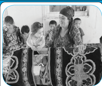
МО МЕЪРОСИ АЖДОДИАМОНРО ҲИФЗ МЕКУНЕМ 4