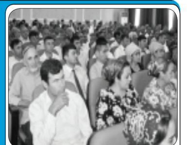
ВОХӮРИИ СУДМАНД БО РАИСОНИ ТАШКИЛОТИ ИБТИДОӢ ВА ВАКИЛОНИ ҲИЗБӢ 8