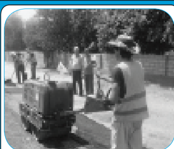
АКСИЯИ “ЯКЧОЯ ХАЛ МЕКУНЕМ!” ДАР АМАЛ 5