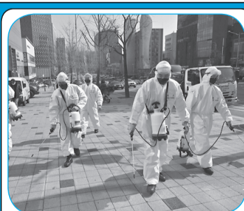
ҲУШӢРИЮ ЗИРАКӢ МЕБОЯД