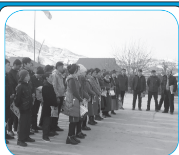
30-СОЛАГИИ ИСТИҚЛОЛИЯТРО САЗОВОР ИСТИҚБОЛ МЕГИРЕМ!