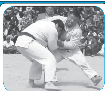
ДАР ШИНОХТИ НАВРӢЗ