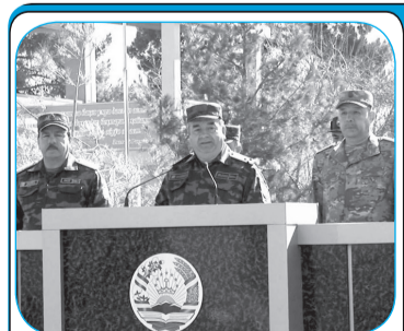
ИШТИРОКИ РАИСИ ВИЛОЯТ ДАР МАШҶҲОИ МУШТАРАКИ НИЗОМӢ

Наврӯзатон фирӯз бод, Ҳар рӯзатон Наврӯз бод!